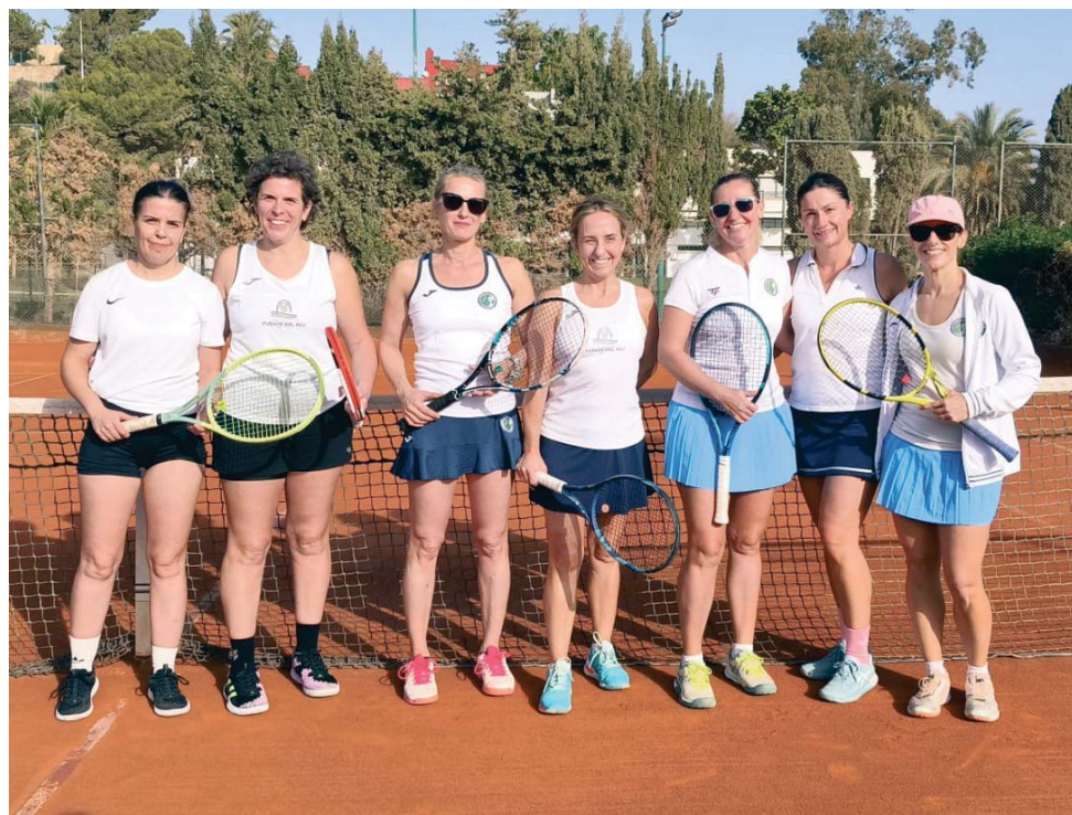
Jugadoras del Club Fuente del Rey que han competido en el Campeonato de Andalucía.