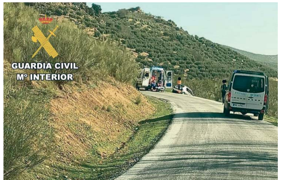
Equipos sanitarios en el lugar del accidente, en la mañana del pasado día 30.

POSITIVO _ El conductor del vehículo, que invadió el sentido contrario de la circulación, dio positivo por consumo de alcohol así como por THC y cocaína