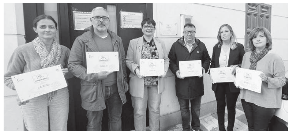
Celebración del vigésimo aniversario de los centros Guadalinfo en la comarca, el día 20.