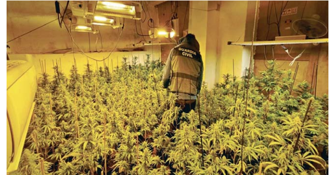
Desmantelamiento en una plantación en Alcalá, en enero.

En este 2024 se ha producido un salto exponencial en lo que se refiere a este tipo de operaciones en Alcalá y comarca. Todas ellas tienen un denominador común, el cultivo intensivo de las plantas, a veces más de 400, se realiza mediante enganches ilegales