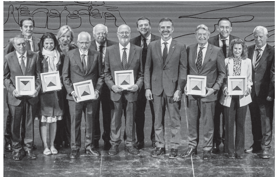
Gala de entrega de los premios de Agricultura, el pasado 27 de noviembre, en Córdoba.