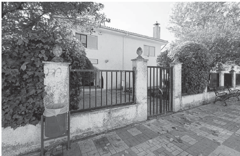
Antiguo Club del Pensionista, habilitado como albergue de temporeros en otras campañas.