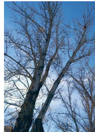
Paisaje de la Sierra Sur.

En lo que a la comarca de la Sierra Sur se refiere, los datos de ocupación que apunta el organismo son del 56,19%. Se trata, prácticamente, del mismo nivel que se registró en el Puente de la Constitu-