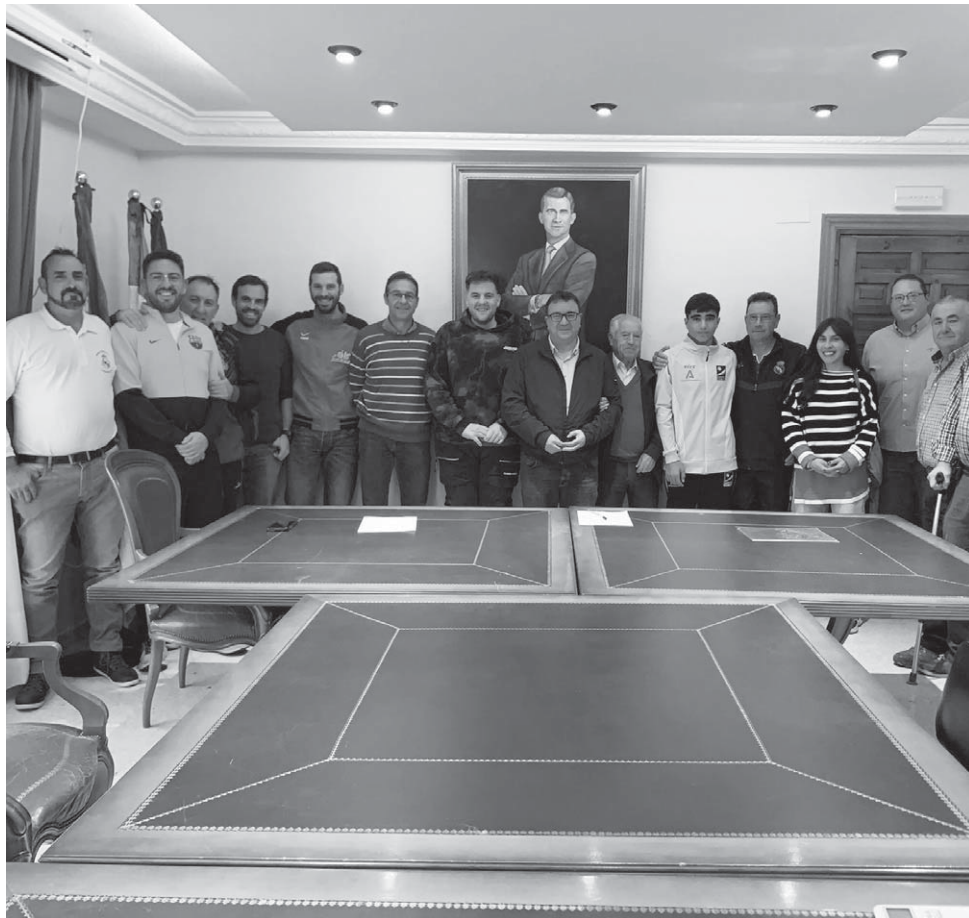
Acto de entrega de subvenciones, el pasado 15 de noviembre, en el Ayuntamiento de Castillo.

APOYO Un total de trece clubes, asociaciones y deportistas a nivel individual han recibido el apoyo del Ayuntamiento castillero este año