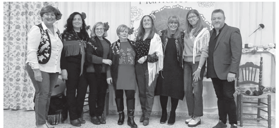
Participantes en la celebración del Día del Flamenco, en el Ceper Arcipreste de Hita.