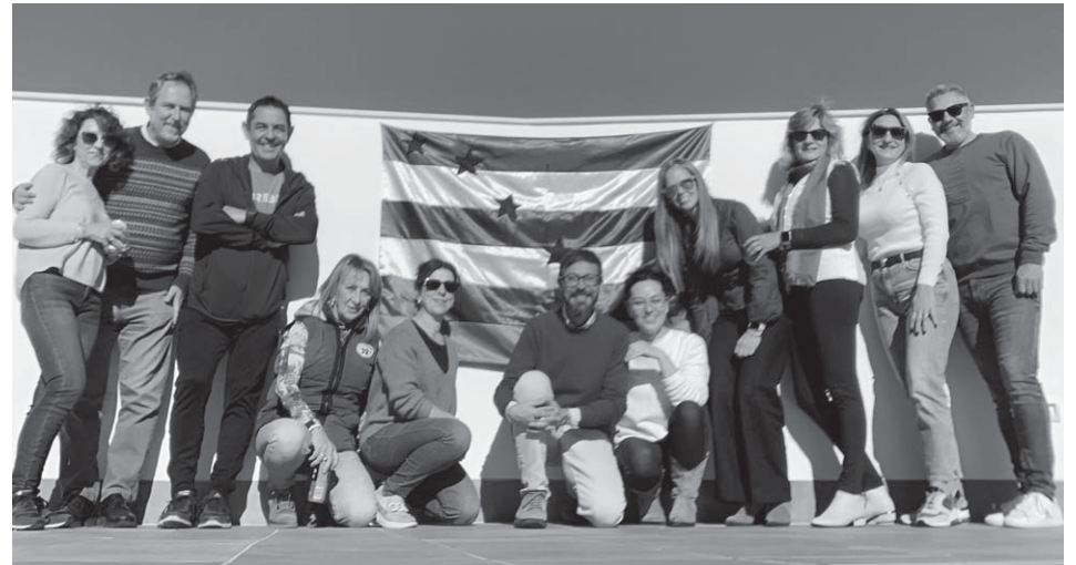
Participantes en la celebración del Día del Orgullo Rural, en El Jardín de Castillo.