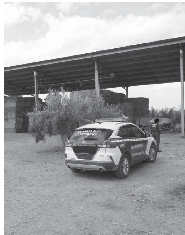
Inspección por parte de Guardia Civil en la explotación.