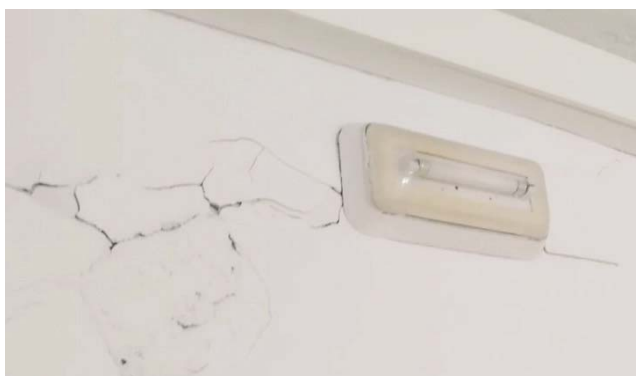
Grietas en el colegio público rural “El Olivo”, en La Pedriza.

ALCALÁ LA REAL | El sindicato Ustea-Jaén ha exigido, en un comunicado, “soluciones” en el Colegio Público Rural El Olivo, de La Pedriza, ya que “presenta deficiencias y desperfectos que son intolerables, como grietas y ausencia de conexión a Internet”. Ustea-Jaén denuncia que el citado colegio público “lleva dos años sin internet a pesar de ser un centro acogido al programa TIC de la Junta de Andalucía”, siendo “inadmisible que la Administración educativa no haya buscado una solución a la falta de acuerdo con la compañía telefónica que debe proporcionarlo”. Igualmente, Ustea-Jaén considera “inaceptable la falta de mantenimiento por parte de las administraciones competentes ya que persisten multitud de grietas en las paredes y el deterioro de suelos y otras instalaciones”.