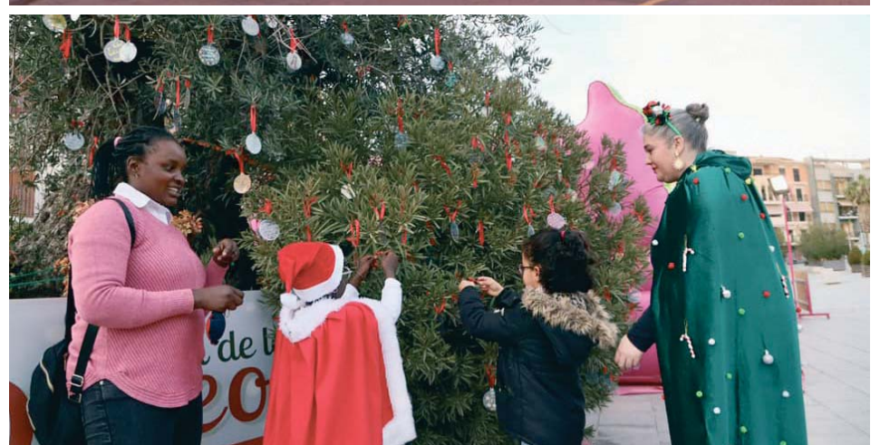
Varias imágenes del ambiente navideño en San Antón y paseo, el pasado 5 de diciembre.