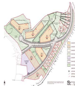
Proyecto de reparcelación.