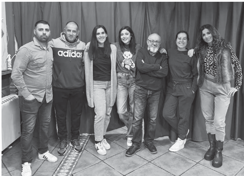
Los integrantes del grupo teatral Placeta Teatro. Abajo, representación de la obra.

REGRESO El taller de teatro de la Hermandad del Santísimo Cristo de la Salud ha vuelto a los escenarios con la comedia “La edad del pavo”, de José Cedena