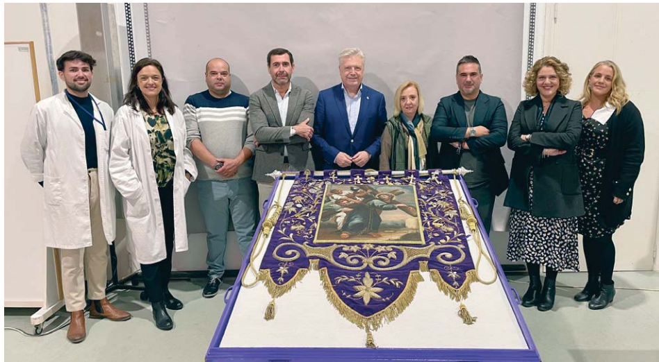
Miembros de la hermandad, junto al Gallardete, el pasado día 22, en Sevilla.