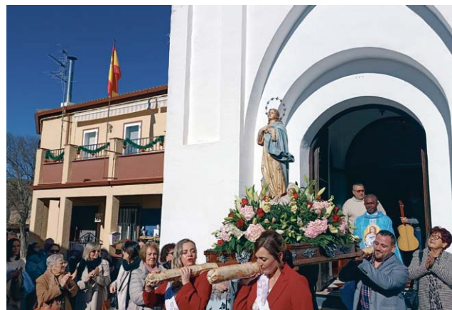
Procesión de la Inmaculada Concepción, en La Pedriza.