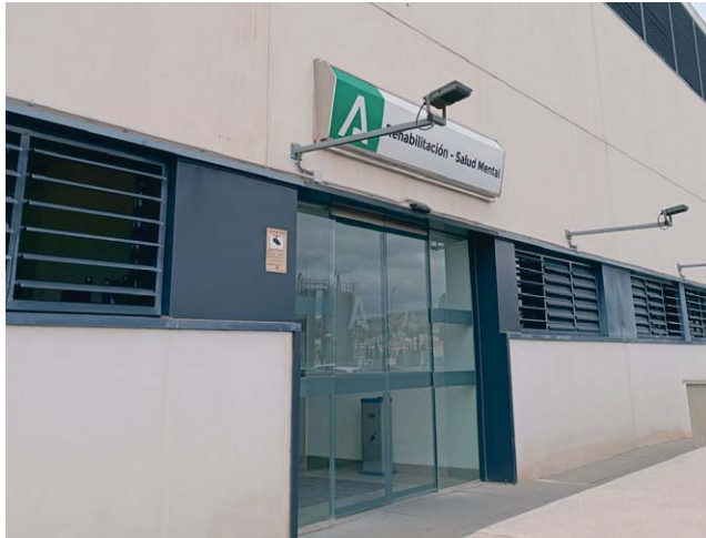
Entrada al área de Salud Mental, en el Chare.

“Por todos son conocidas las especiales características de nuestro municipio, la zona de la Sierra Sur y la Subbética. Es por ello que siempre hemos tenido una especial sensibilidad con la salud mental y con los profesionales que actúan en