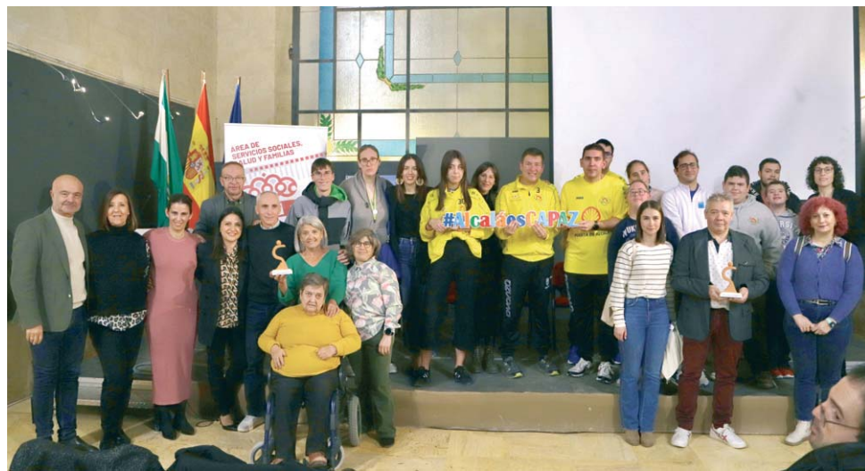
Entrega de los premios Alcalá Inclusión, el pasado 3 de diciembre, en Capuchinos.