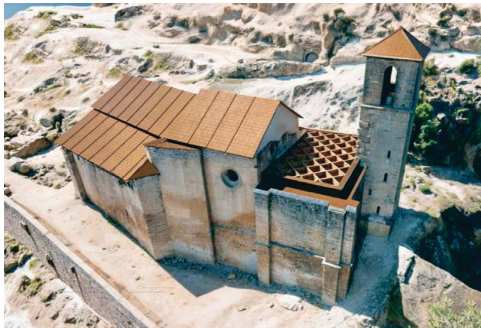
Recreación de la iglesia de Santo Domingo de Silos, cuya rehabilitación finalizará en 2026.